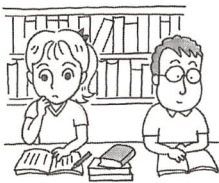
in the library