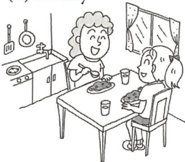
at her friend's house