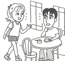
at a coffee shop