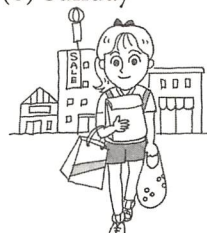
at a department store